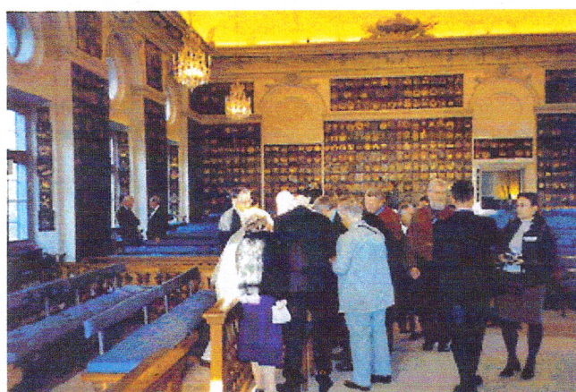
Delar av släkten samlades i Riddarhussalen för att se vårt fina sköldbrev som förvärfvades under senaste släktträffen på Riddarhuset.

några för oss viktiga beslut och saker som vår styrelse lagt som förslag till oss övriga medlemmar och släkt.